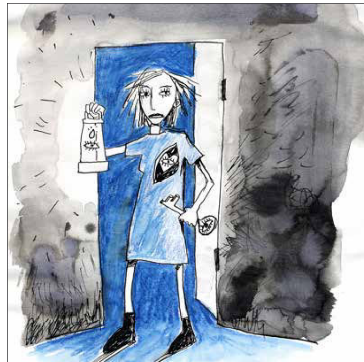
// die kammer (the chamber) // violence against women // fairy tale illustration, unpublished